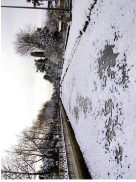
Asciutta del canale Brentella con neve