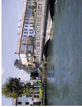
Brentella a Crocetta