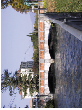
Ponte sul Brentella a Crocetta

Oltre all'incontro l'Amministrazione Comunale di Crocetta propone la visita gratuita delle strutture del Consorzio di Bonifica Piave, subentrato al Consorzio Brentella.